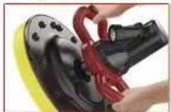
双手操控 轻松施工 手持式操作更稳定可靠