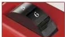
6挡调控 速度自由掌控