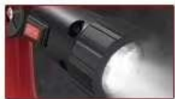
180° 旋转LED照明灯 适应各种施工环境