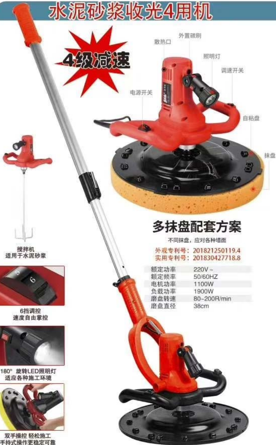
搅拌机 适用于水泥砂浆